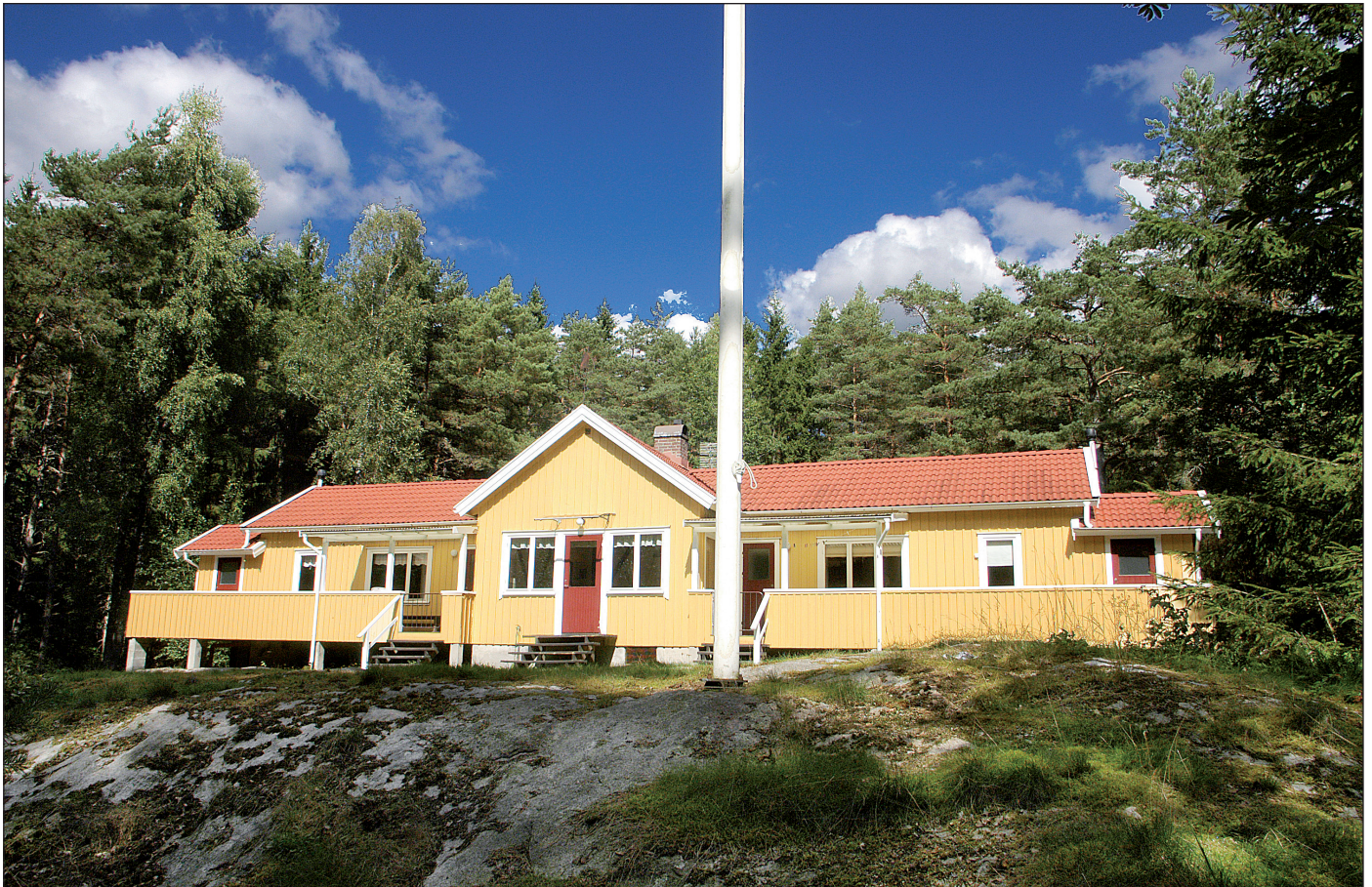
Ungdomsgården södra utgörs av högra halvan sett härifrån. Mittendelen med spetstaket är storstugan, ett rum gemensamt med Ungdomsgården norra.