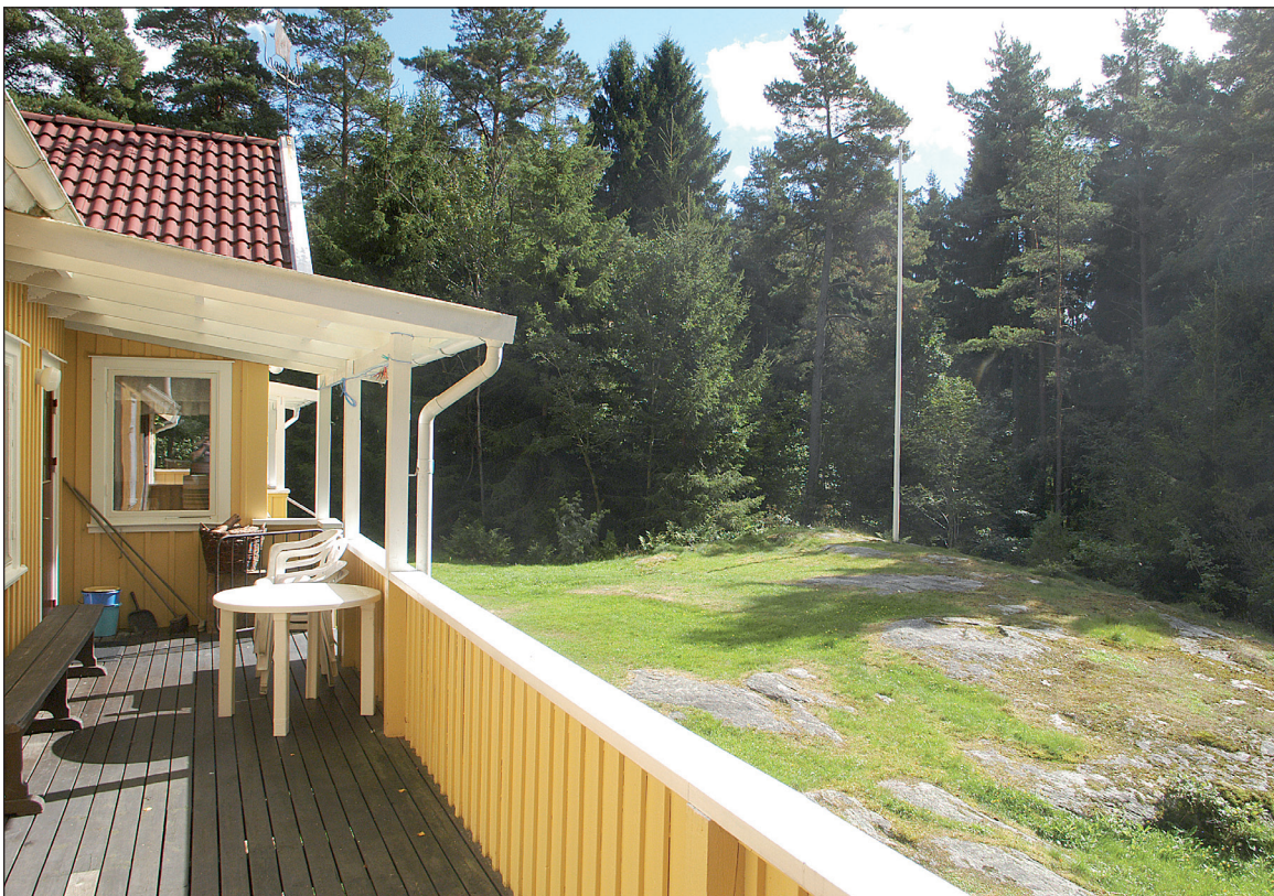
Markytan utanför husets södra sida, sett från den norra altanen.

* Dörren mellan hallen och storstugan – det gemensamma rummet för norra och södra Ungdomsgården – går att låsa.