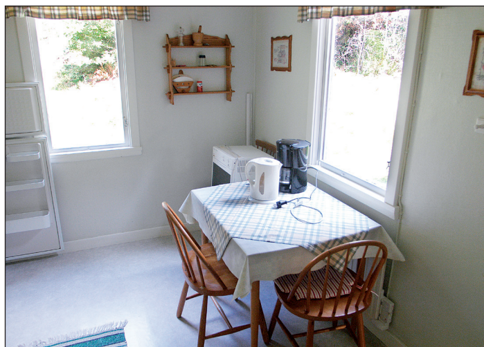
Ungdomsgården södra – vy från öster.

Tiderna förändrades sedermera och 1981 byggdes huset om till två separata familjebostäder.