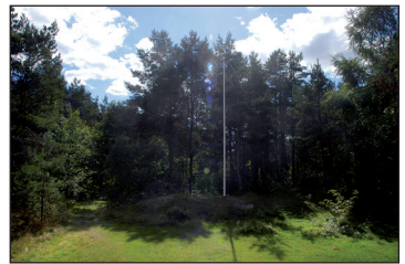
Bakke och utsikten åt söder.