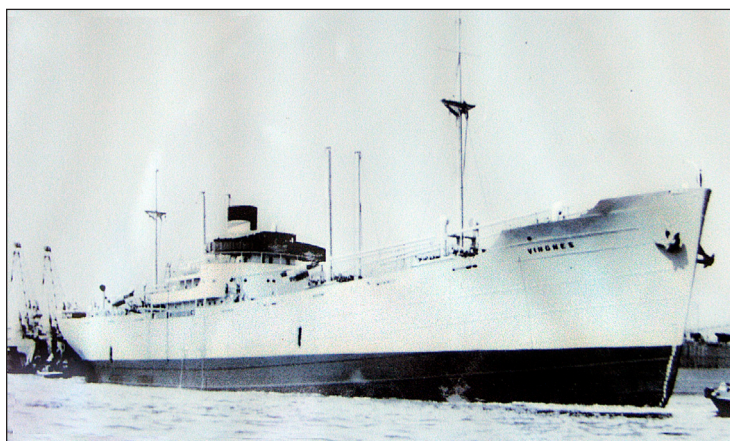
Vingnes levererades 1945 till Skibs A/S Nordheim i Oslo, Norge.

Stugan Vingnes byggdes år 1950 och fick sitt namn efter lastlinjefartyget Vingnes som byggdes av Götaverken (byggnr 548). Fartyget hade följande huvuddimensioner: Längd över allt: 442' 9" Mallad bred: 56' 6" Mallat djup: 38' 0" Dödvikt: 9.370 DWT Dräktighet: 5.201 BRT Framdrivningsmaskineriet var en Götaverken/B&W Diesel med åtta cylindrar 740/1500 med en sammanlagd effekt av 4.200 AHK som gav fartyget en fart av 13.75 knop med full last.