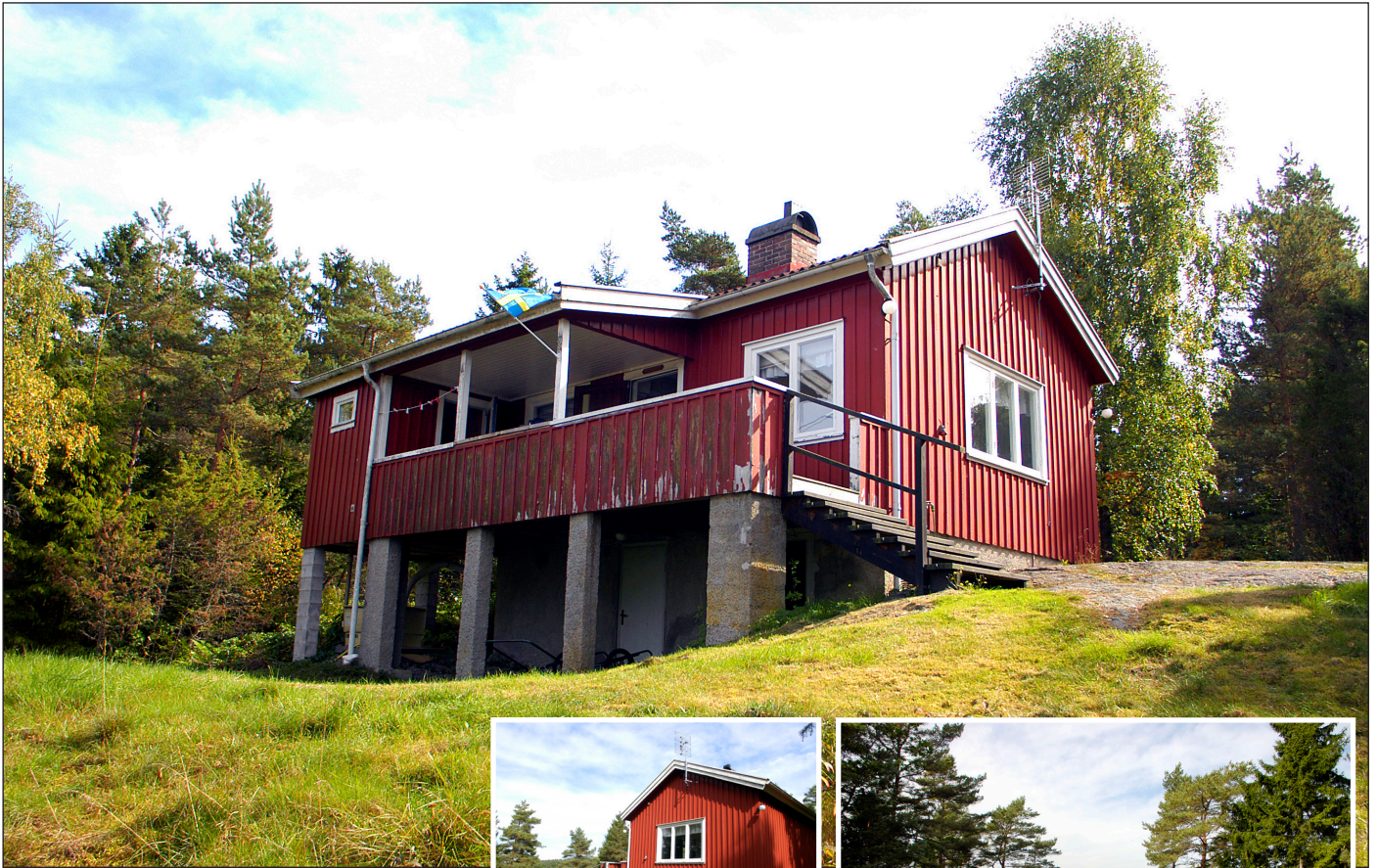
Vingnes och utsikten åt väster.