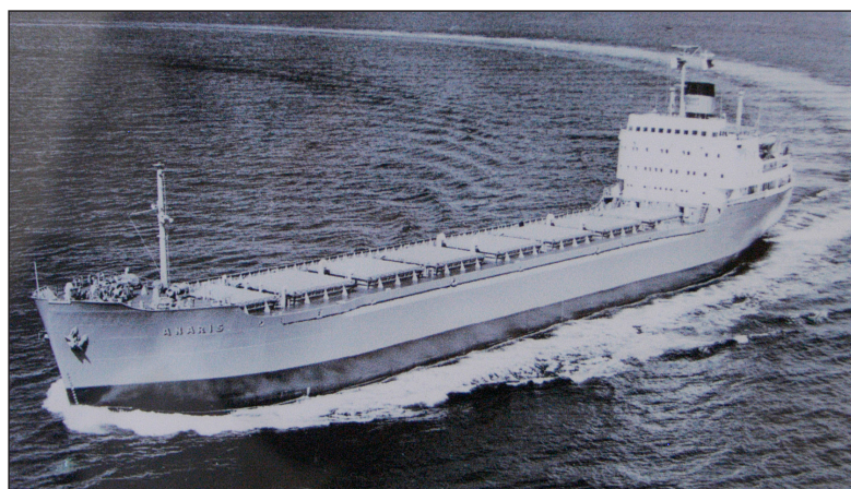
Anaris levererades 1962 till Trafik AB Grängesberg-Oxelösund, Stockholm.

Stugan Anaris byggdes år 1963 och fick sitt namn efter bulkfartyget Anaris som byggdes av Götaverken (byggnr 756). Fartyget hade följande huvuddimensioner: Längd över allt: 490' 0" Mallad bred: 64' 0" Mallat djup: 42' 6" Dödvikt: 15.360 DWT Dräktighet: 10.848 BRT Framdrivningsmaskineriet var en Götaverken Diesel med sju cylindrar 680/1500 med en sammanlagd effekt av 5.000 AHK som gav fartyget en fart av 14,25 knop med full last.