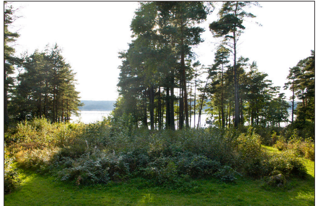
Anaris och utsikten åt väster.