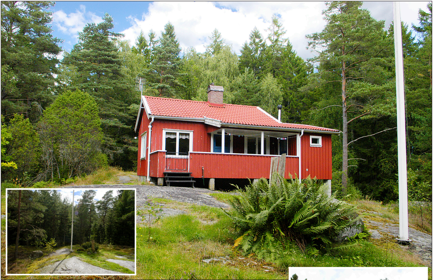
Jacobsberg och utsikten åt söder.