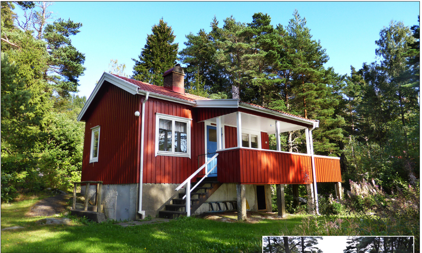
Ariston och utsikten åt väster. Det finns en ramp till verandan.