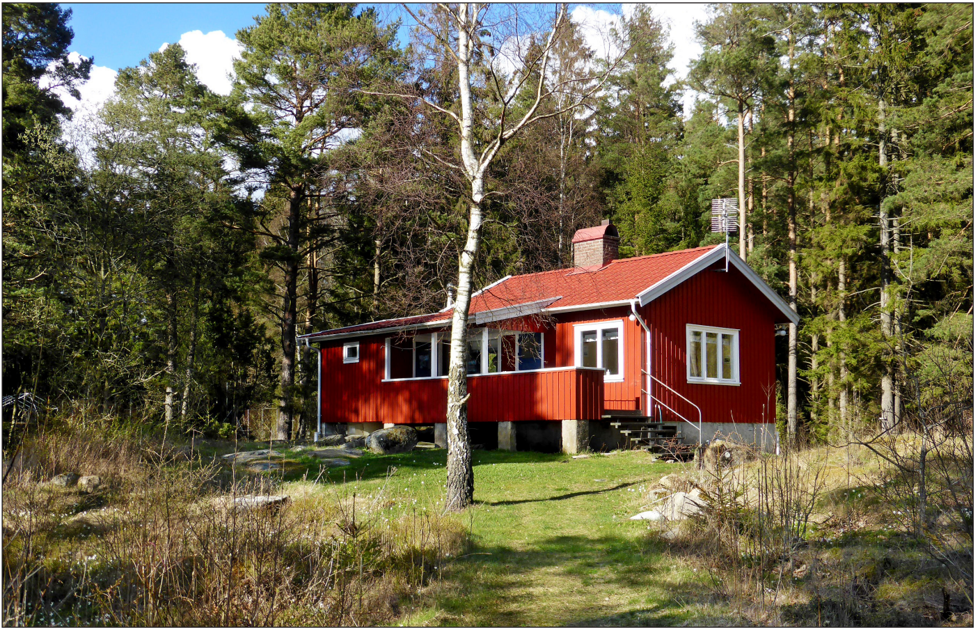
Tønnevold och utsikten åt väster.