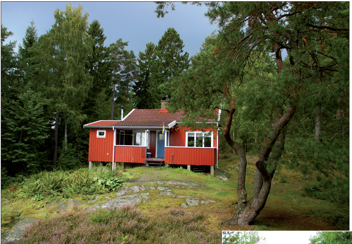
Hedenhöjd och utsikten åt väster.