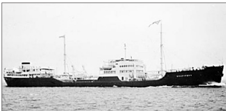
Brattfonn levererades 1950 till Skibs A/S Dalfonn i Stavanger, Norge.

fartyget en fart av 15.0 knop med full last.