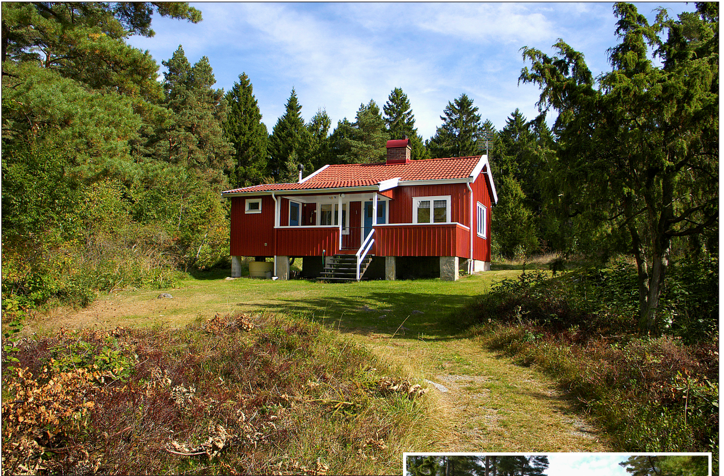
Heymania och utsikten åt väster.