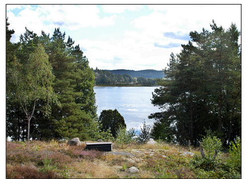
Holtefjell och utsikten åt öster.