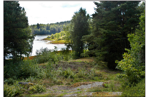
Utsikten åt söder.