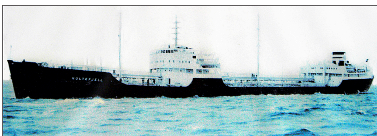
Holtefjell levererades 1952 till Skibs A/S Dieseltank i Oslo, Norge.

Stugan Holtefjell byggdes år 1954 och fick sitt namn efter tankfartyget Holtefjell som byggdes av Götaverken (byggnr 662). Fartyget hade följande huvuddimensioner: Längd över allt: 512' 2" Mallad bred: 64' 0" Mallat djup: 38' 2" Dödvikt: 15.900 DWT Dräktighet: 9.894 BRT Framdrivningsmaskineriet var en Götaverken Diesel med åtta cylindrar 680/1500 med en sammanlagd effekt av 6.000 AHK som gav fartyget en fart av 14.5 knop med full last.