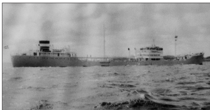
Ranja levererades 1949 till Rederi A/S Ruth i Oslo, Norge.

Diesel med sex cylindrar 680/1500 med en sammanlagd effekt av 4.200 AHK som gav fartyget en fart av 13.0 knop med full last.