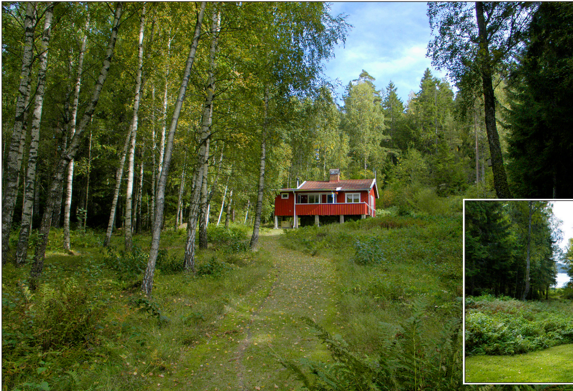
Ranja och utsikten åt väster.